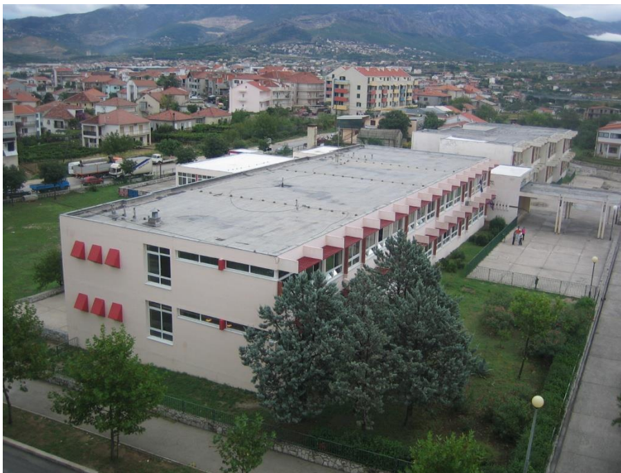
OŠ RAVNE NJIVE- NESLANOVAC SARAJEVSKA 30 SPLIT