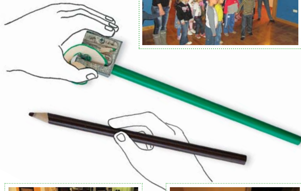
Stara lutka, MGS 5588

koji se tu nalaze. Kako slikari koriste boje, kako biraju motive i što nam njihove slike uopće govore? Sve ćemo to doznati u neobičnom ambijentu Vidovićeve galerije, a sigurno je da će nas ova priča nadahnuti da u galerijskoj radionici i sami postanemo mali umjetnici.