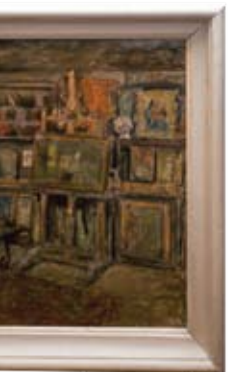
E. Vidović "Stari atelier" oko 1938. ulje na papiru MGS 4178